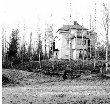
Figur 5 Sjölunda

Kvinnorna var klädda i långa kjolar, underkjolar, linnen, livstycken, byxor. Livstyckena var hemsydd. På vintern bar man ett par underkjolar. På själva kjolen syddes ett ”plysband”, ett slags förstärkning eftersom kjolarna nästan släpade i backen. Som liten flicka hade man korta kjolar, och som vuxen kvinna hade man långa kjolar med hög hals. Det var ylle på vintern och bomull på sommaren.